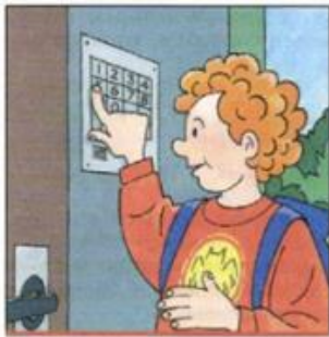
Пользуйтесь домофоном, чтобы вас встретили в подъезде