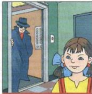
Не входите в лифт с незнакомыми людьми

1. Пользуйтесь домофоном, чтобы вас встретили в подъезде.