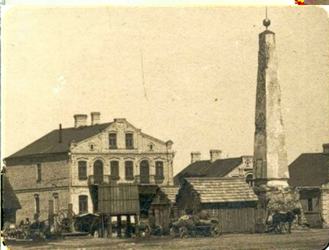
Гандлёвая плошча пачатку XIX стагоддзя