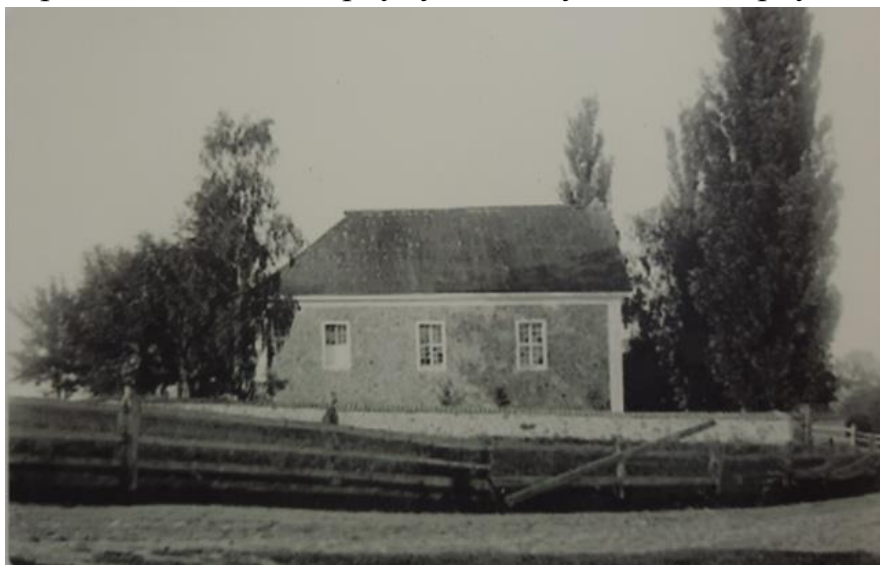
Вялікая Свянціца. Пачатак ХХст.

У 1914 годзе ў маёнтку Свянціца Вялікая пражывала 150 жыхароў, у Свянціцы Малой – 17 жыхароў, царкоўная прычта налічвала 22 жыхары. Дзейнічала