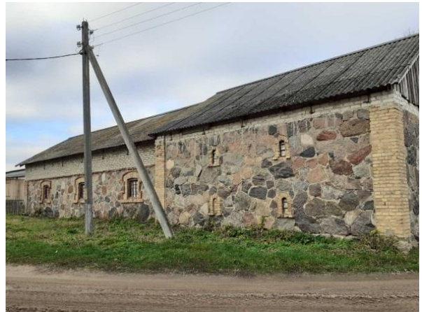
Будынак панскага склада

У 1861 годзе ў Свянціцы Малой адкрыта народнае вучылішча.