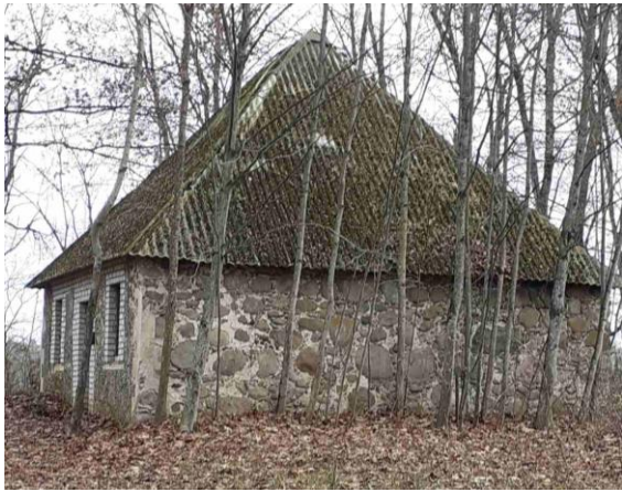
Будынак панскай лядоўні