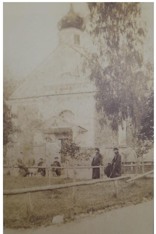
Царква Святой Параскевы Сербскай. Пачатак ХХст.